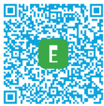
Plaque Evaluation Préliminaire

L'Evaluation Préliminaire permet d'étudier une situation afin d'apprécier la pertinence d'un parcours de Pré-Orientation, de Réadaptation Professionnelle ou de Formation Accompagnée. Elle permet également d'en définir les modalités et d'accompagner leur mise en œuvre de manière concertée avec la personne.