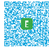
Fiche de prescription (partenaire)